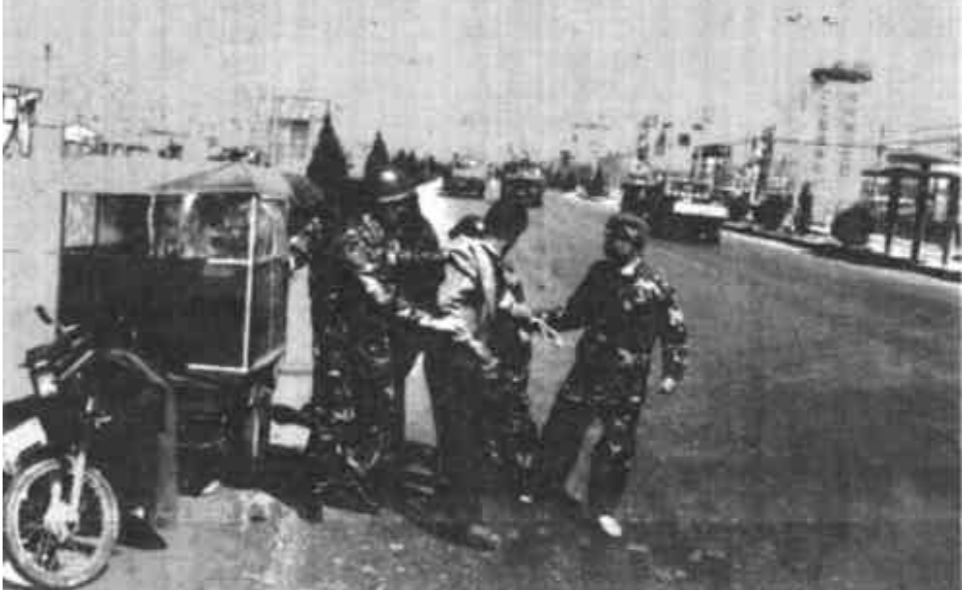
3月24日中午11时左右，胜利镇派出所接到110报警，有人正在莱州饭店自行车棚内出租三轮摩托车偷窃自行车，干警们接到报警后在两分钟内迅速到达案发现场，发现罪犯已驱车向南逃窜，110警车奋起直追，追至运输四村截获窃贼和赃物。