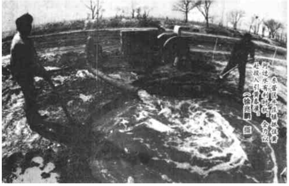
牛年用足“牛”劲搞好“抗旱双保”

广饶讯 广饶县丁庄镇信用社想农民所想，急农民所急，积极发放贷款，支援春耕生产。这个信用社牢记“农业发展我发展，我与农业共兴衰”的指导思想，充分发挥职能作用，积极为农民排忧解难。去年，该镇遭受了严重的洪涝灾害，农业生产受到损失，农民手中资金不足，针对这一情况，信用社领导带领业务人员，深入村户，了解资金需求情况，制定计划及时发放贷款。他们还与镇供销社联合支农，信用社把贷款放给供销社，供销社将农资送给农户，从而方便了群众。目前，这个信用社已发放支农资金近百万元，比往年同期有明显增加。(吴国良 薛晓俊)