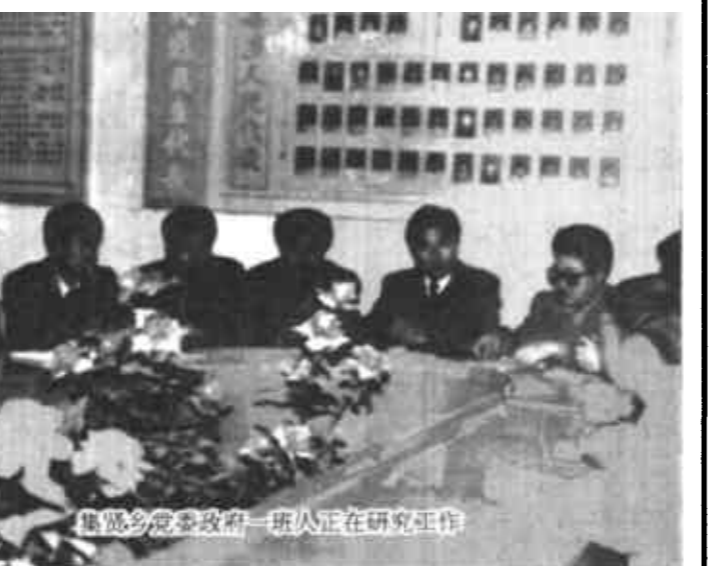
集贤乡党委政府一班人正在研究工作

六是坚持高境界，改变“一手硬、一手软”的问题，努力提高全乡人民整体素质。坚持两手抓，两手都要硬，下大力气抓好精神文明建设，搞好农村精神文明建设“三个一”基础工程，推动全乡精神文明建设再上新台阶。总之，我们一定要抓住机遇，大力弘扬“团结求实、艰苦创业、顾全大局、无私奉献、创新争先”的精神，努力夺取全乡两个文明建设的新胜利，以实际行动迎接党的十五大胜利召开！